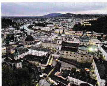
Stânga: Salzburgul văzut de pe Festungsberg

Nu renumele sa de centru arheologic (care a făcut ca prima perioadă a epocii fierului să îi poarte numele) este cea care atrage un număr mare de turiști la Hallstatt. Primul său atu este cadrul natural încântător, alcătuit de crestele abrupte ale Dachstein și apele verzui ale Hallstättersee între care formează un superb amfiteatru case înalte cu balcoane din lemn, iar cel de-al doilea atu este în apropiere a Salzburgwerk, cea mai veche mină de sare din lume.